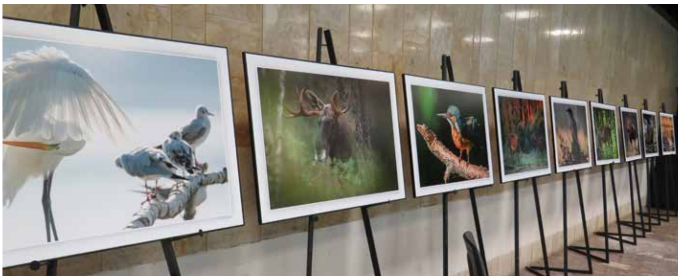
Fragment wystawy fotograficznej Przyroda w obiektywie